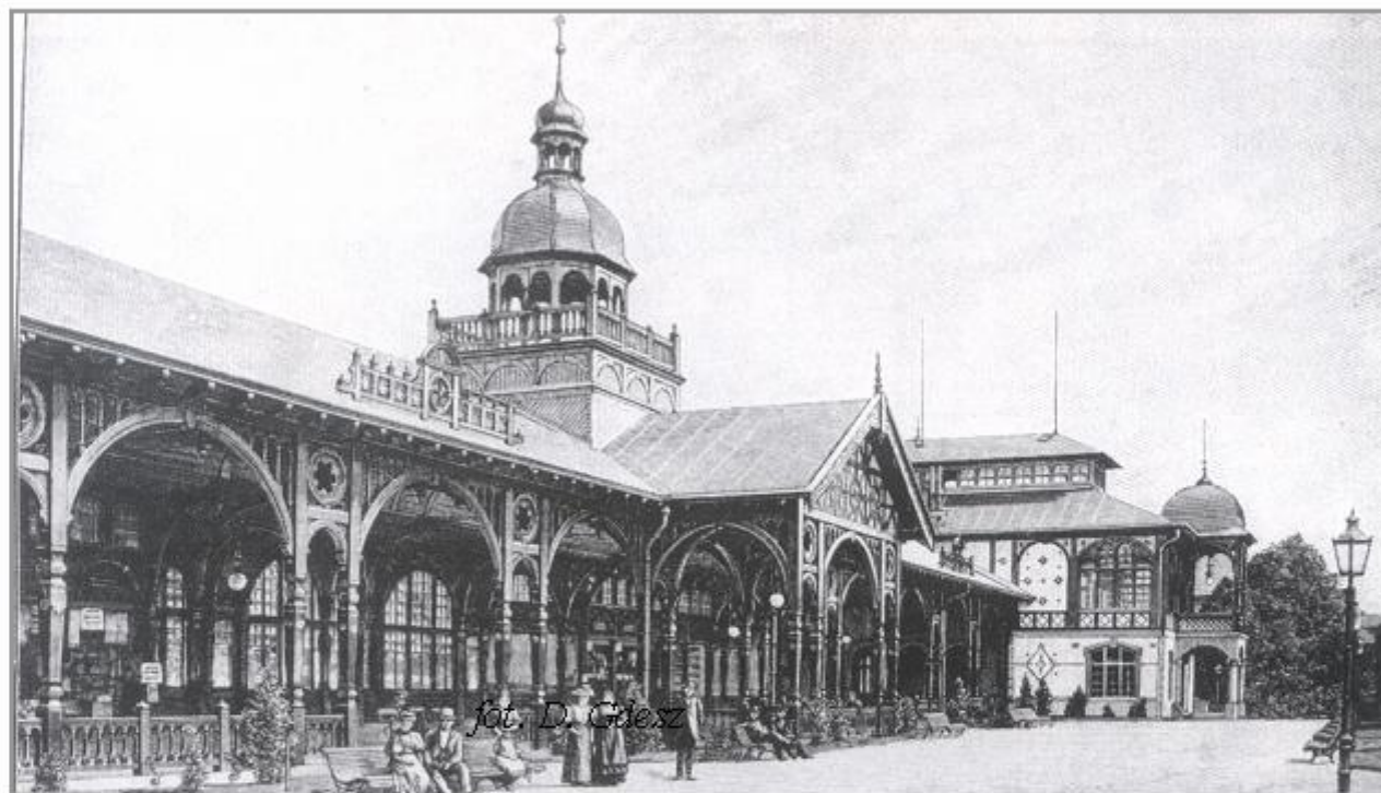
Hala spacerowa i pijalnia wód mineralnych