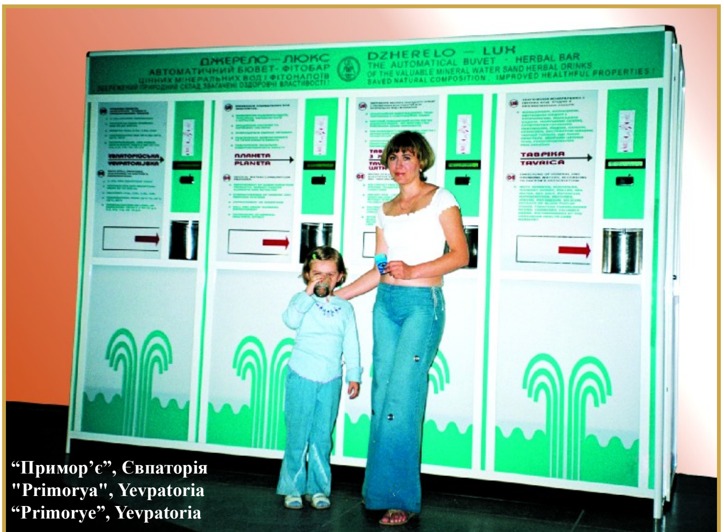
“Примор’є”, Євпаторія "Primorya", Yevpatoriya “Primorye”, Yevpatoriya

THE MINISTRY OF HEALTH OF UKRAINE DEEMS IT NECESSARY THAT THE RUDIMENTARY PUMP-ROOMS EQUIPMENT WITH NON-HERMETIC TANKS AND TE HEATERS BE REPLACED WITH THE RELIABLE AND TESTED SYSTEMS "DZHERELO-LUX". The reason is that the outdated facilities oxidize curative waters, heat them over the admissible temperature of 40°C, destroy their natural composition, microflora and medicinal qua-