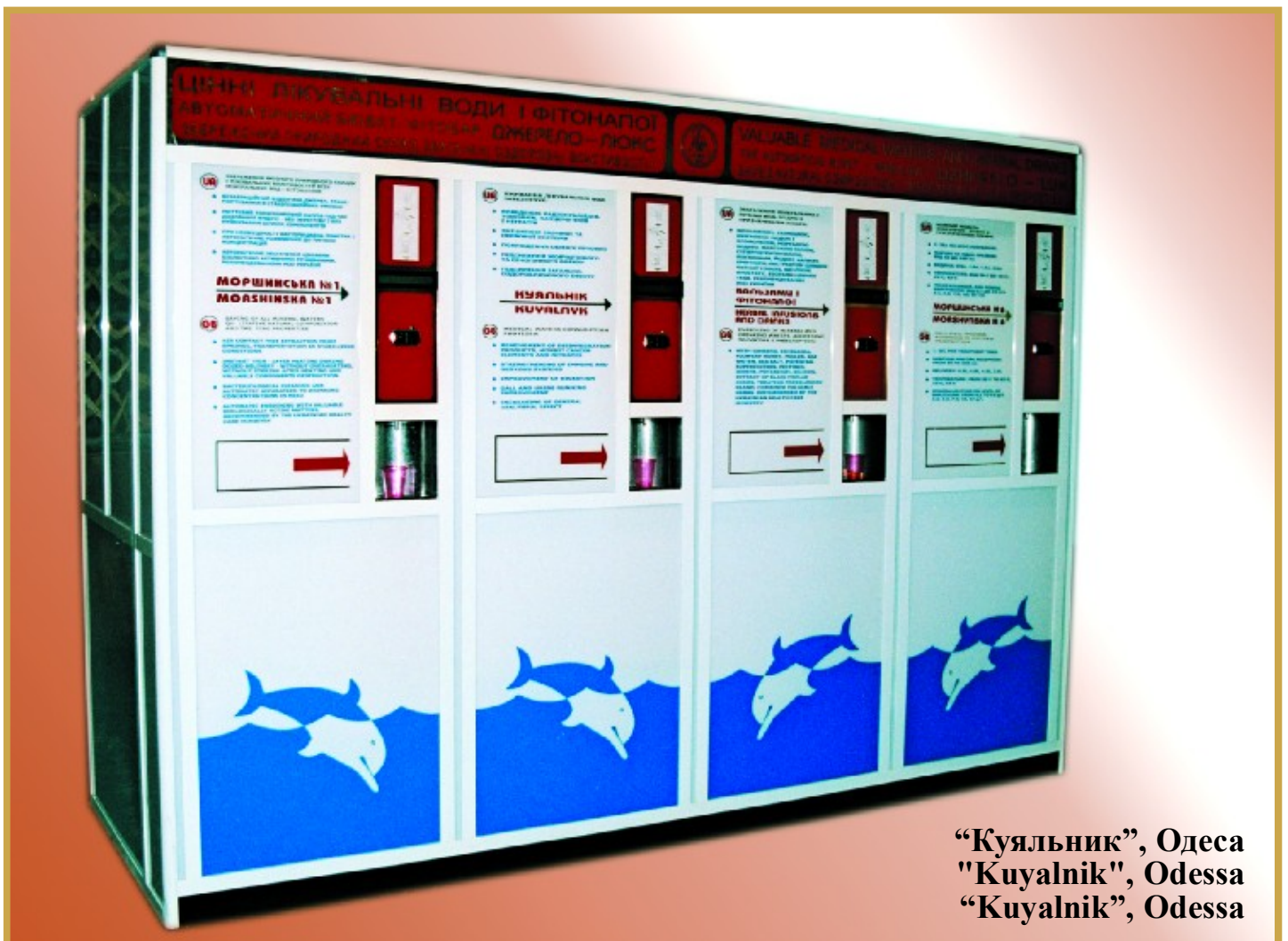
“Куяльник”, Одеса "Kuyalnik", Odessa “Kuyalnik”, Odessa

4. Conclusion hygiénique du Ministère de la Santé Publique de l'Ukraine sur les buvettes automatiques de "Dzherelo-Lux"