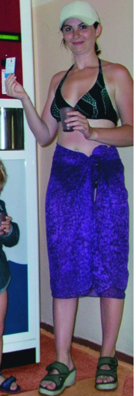
“Ай-Петрі”, Ялта "Ai-Petri", Ialta "Ay-Petri", Yalta