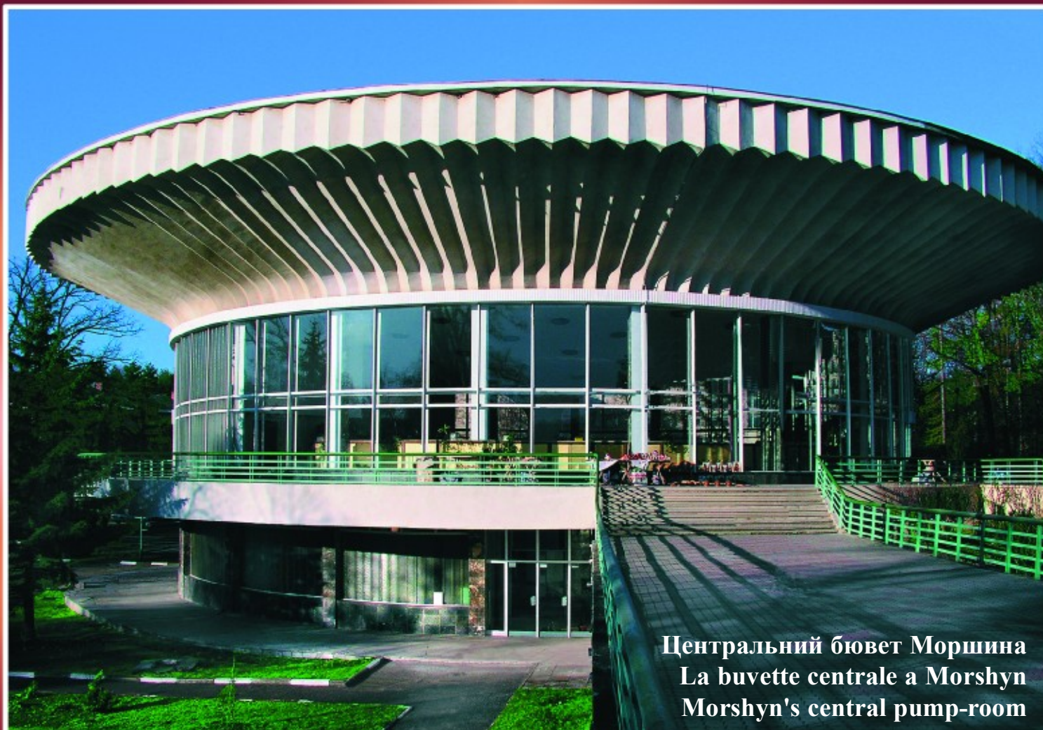
Центральний бювет Моршина La buvette centrale a Morshyn Morshyn's central pump-room

IL N'Y A UNE STATION THERMALE EN EUROPE COMME MORSHYN